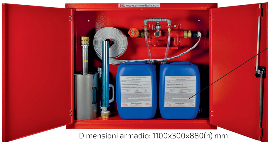
Dimensioni armadio: 1100x300x880(h) mm